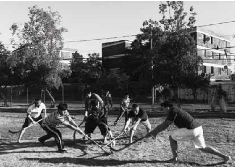
Un grupo de mapuches juega al palin en el centro ceremonial Mahuidache, en la comuna de El Bosque. Santiago, Región Metropolitana, Chile. 2014