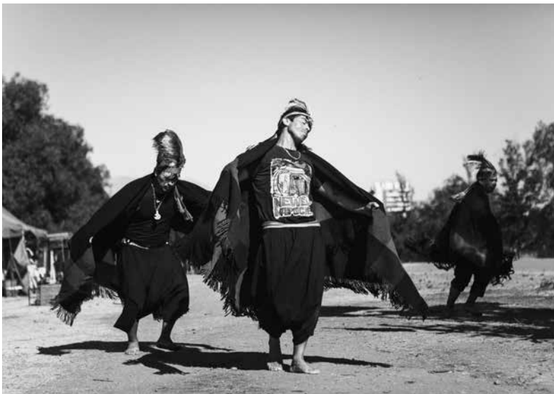
Tres jóvenes interpretan el baile del choike purrun durante la celebración de un guillatún. Santiago, Región Metropolitana, Chile. 2014