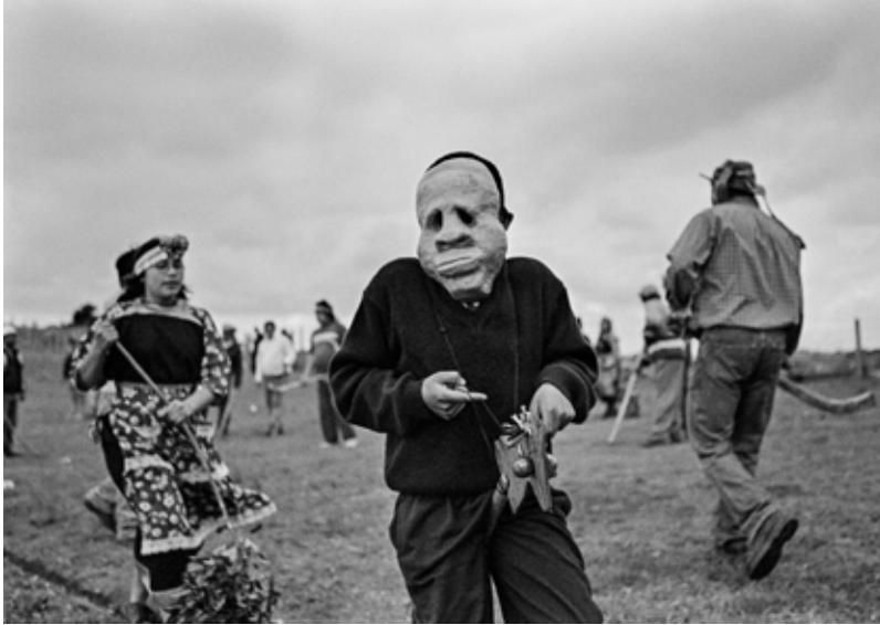
Un individuo luce una máscara de kollón durante un juego de palin, deporte típico de la cultura mapuche. Puerto Domínguez, Cautín, Región de la Araucanía, Chile. 2007