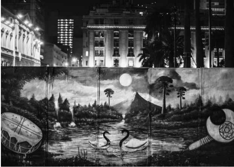
Un mural de autor desconocido decora los paneles que encierran la plaza de Armas durante su remodelación. | Santiago, Región Metropolitana, Chile. 2014