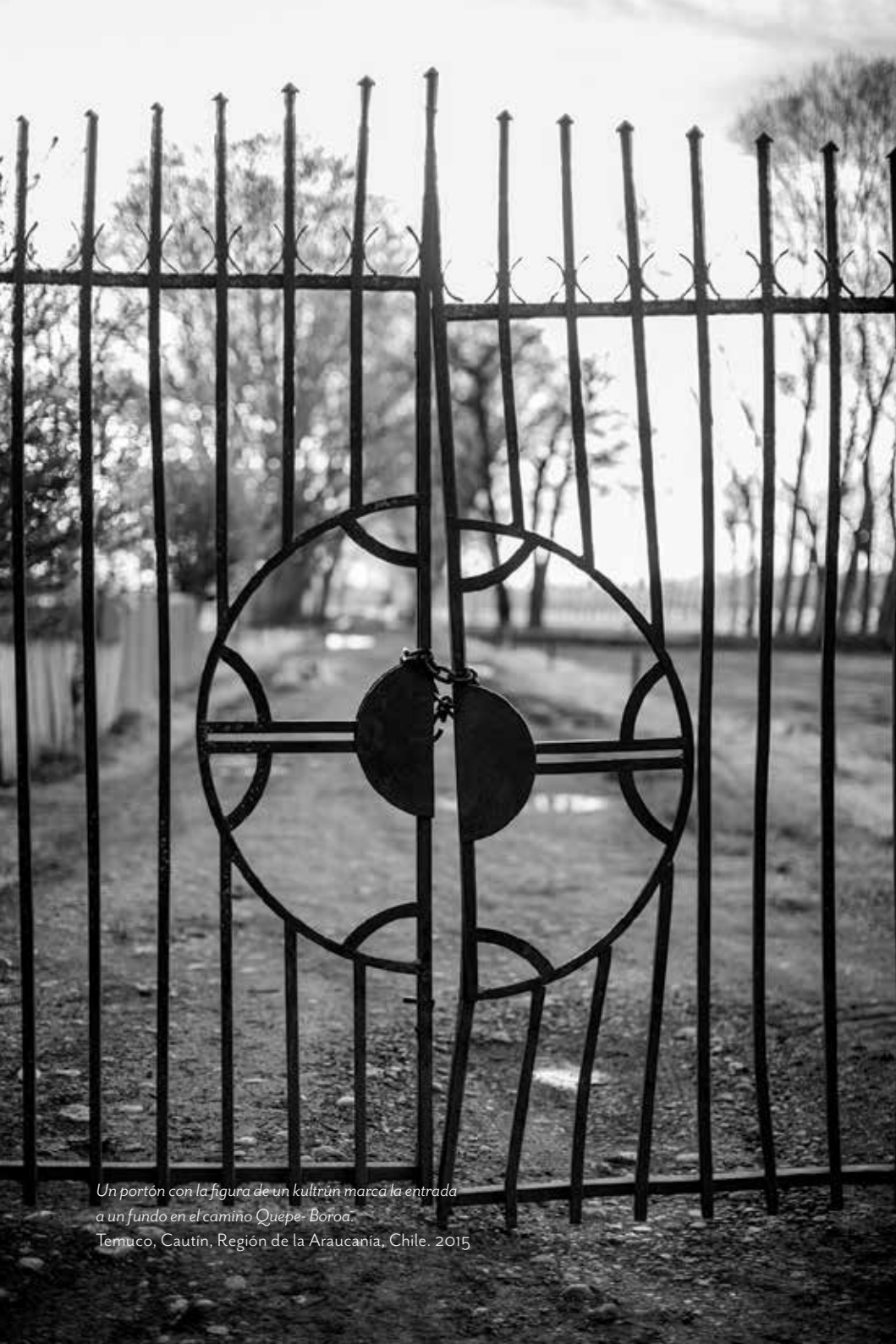
Un portón con la figura de un kultrún marcó la entrada a un fundo en el camino Quepe- Boroa. Temuco, Cautín, Región de la Araucanía, Chile. 2015