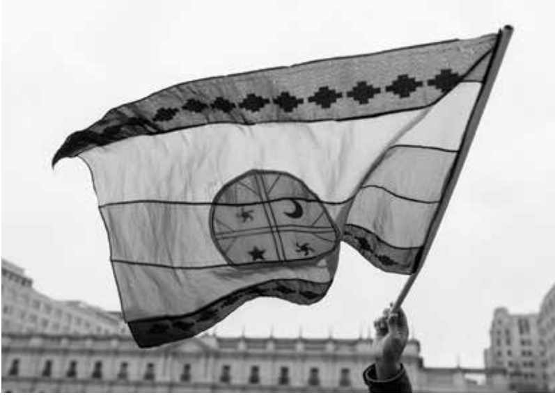
Una bandera mapuche flamea frente al palacio de La Moneda, sede de gobierno. Santiago, Región Metropolitana, Chile. 2015