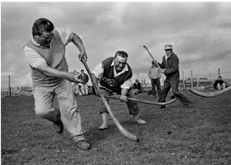
Dos jugadores se batan durante una partida de palin. Puerto Domínguez, Cautín, Región de la Araucanía, Chile. 2007