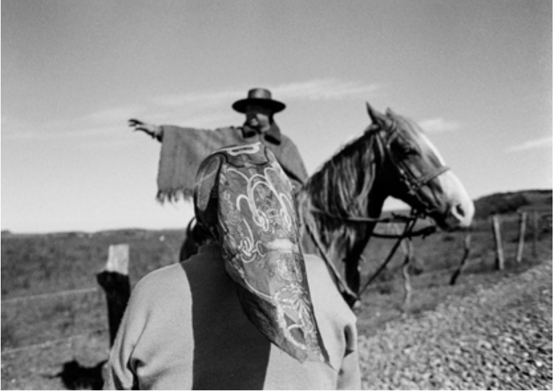
Una mujer mapuche pide indicaciones a un hombre a caballo que encuentra en su camino. Deume, Cautín, Región de la Araucanía, Chile. 2005