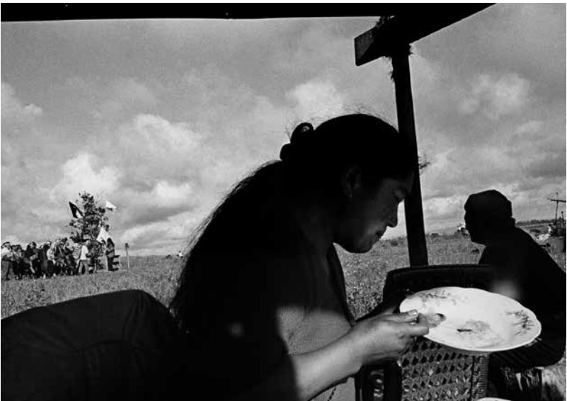
Un grupo de familias se reúne en torno al rehue durante la celebración de un guillatún. Puerto Saavedra, Cautín, Región de la Araucanía, Chile. 2007