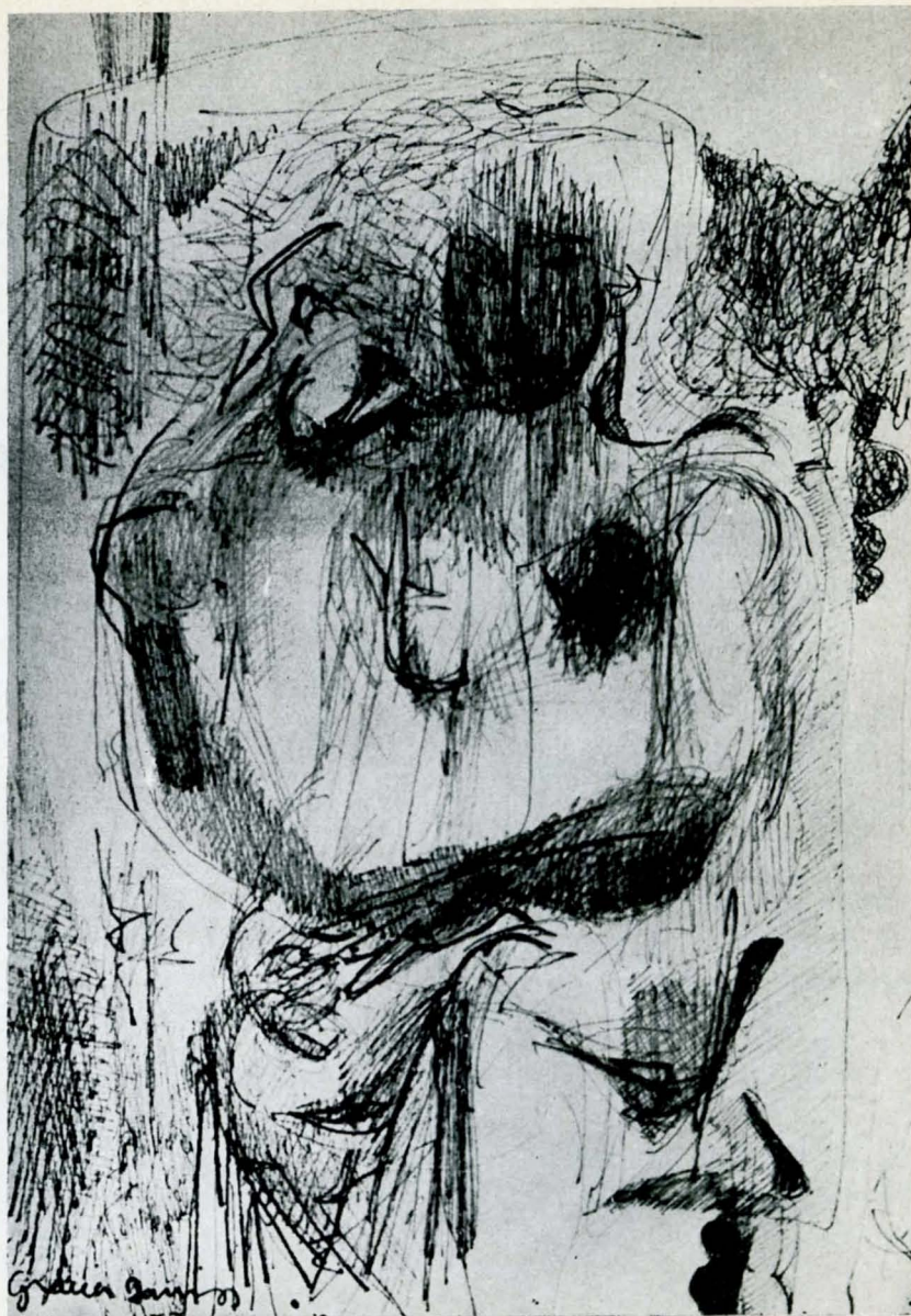
Primer Premio de Dibujo y Grabado: Gracia Barrios