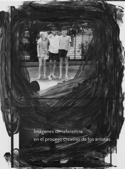
Imágenes de referencia en el proceso creativo de los artistas.