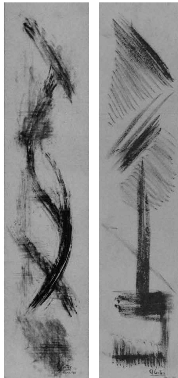
Composición no figurativa, 1961 Carboncillo sobre papel 64 x 14 cm c/u Colección particular