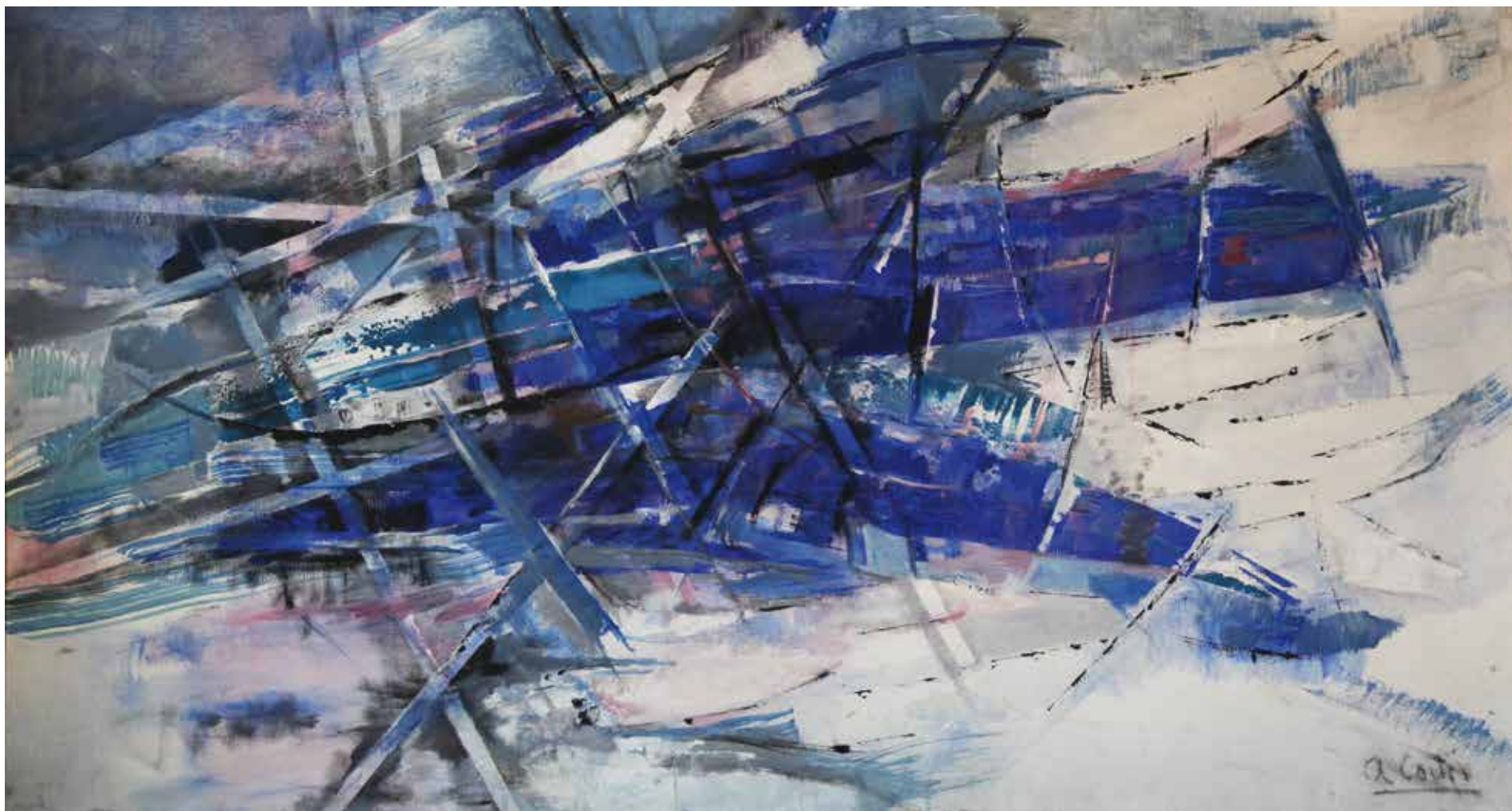
Composición no figurativa , sin fecha Óleo sobre tela 77,5 x 140,5 cm Colección particular