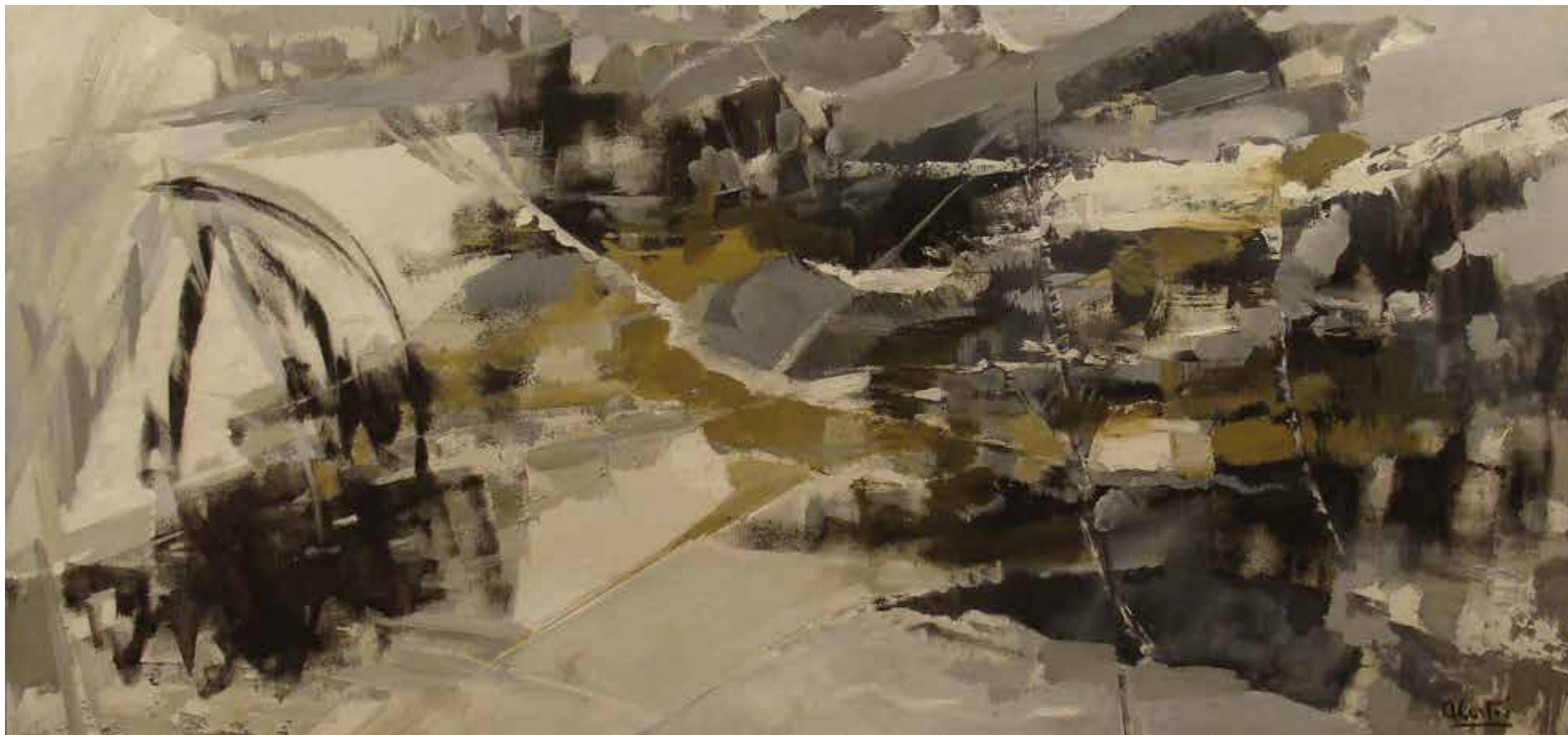
Composición , sin fecha Óleo sobre tela 160 x 72 cm Museo Nacional de Bellas Artes