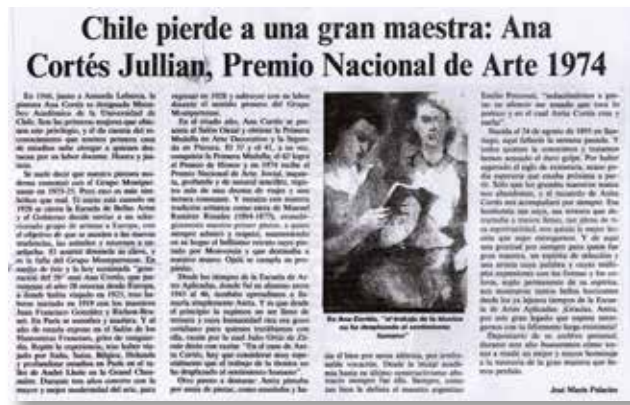
La Segunda, 12 de enero de 1998