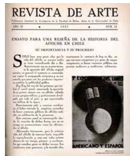
Revista de Arte, Año III, N°15, 1937

“Creo que para un artista enseñar a estudiantes artistas es motivo de renovación y estímulo para la propia creación... Por casi tres décadas tuve el privilegio de enseñar, sin interrupción, en cursos diurnos y nocturnos; estos últimos, integrados en su mayoría por obreros y profesionales. En tales cursos aprendí a querer profundamente a nuestra gente, a estimarla por su calidad, por sus grandes dotes artísticas, por su inherente dignidad. Aprendí a valorar y a respetar a nuestro pueblo. Aprendí a ser más humana” 29 .