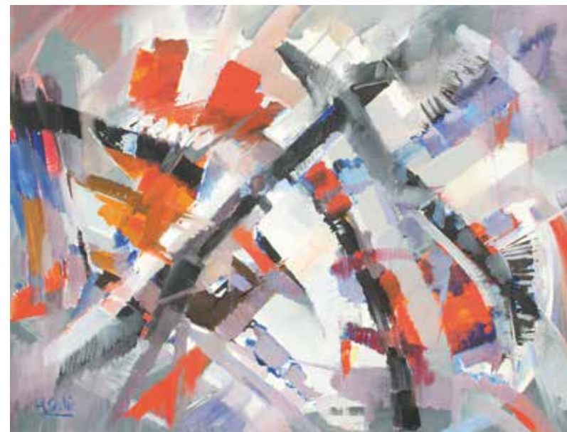
Peligro aéreo , 1960 Óleo sobre tela 75 x 99 cm Colección particular

En las obras sintéticas, de pincelada visible y suelta, los planos de color conforman un principio plástico de rasgos esquemáticos, cuyas composiciones tienden a ordenarse en el centro de la tela.