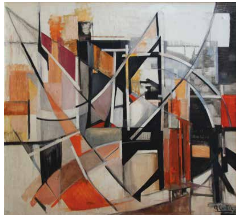
Ciudad , 1964 Óleo sobre tela 100 x 100 cm Colección particular

Las pinturas abstractas de Ana Cortés ofrecen dos formas de rasgos distintivos diferenciados. Están aquellas donde algunos motivos figurativos interactúan con elementos geométricos que circundan a los primeros, como nexos con la realidad. Están también aquellos exclusivamente planos que entran secciones geométricas, puramente plásticos y por tanto más radicales en sus intenciones.