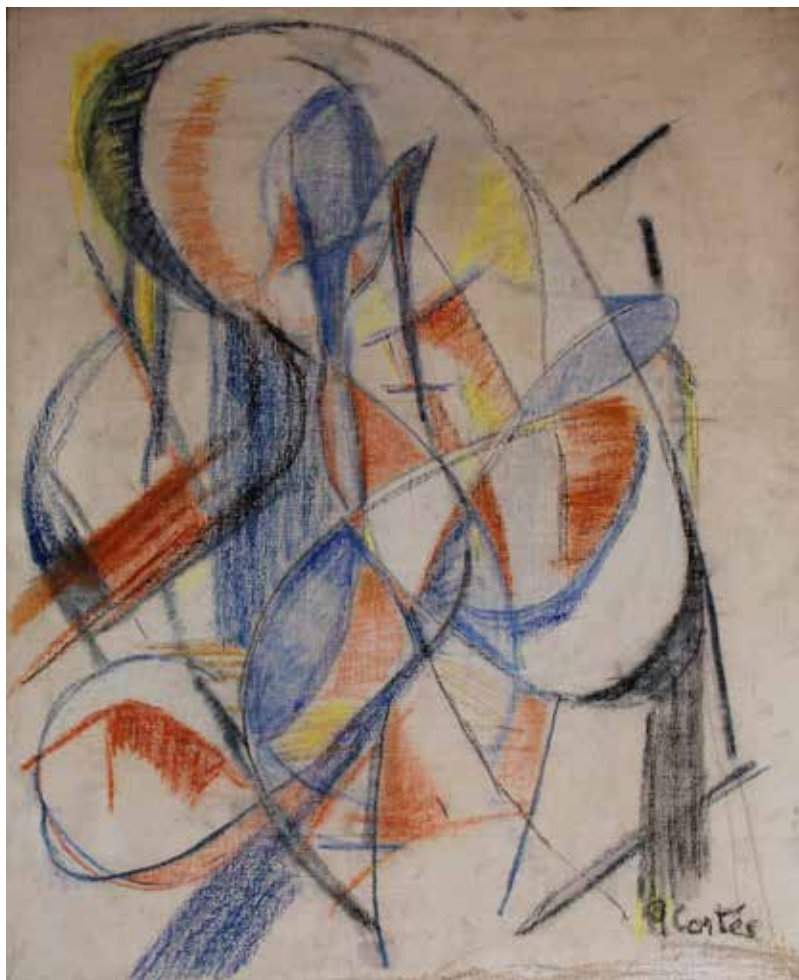
Ensayo , sin fecha Pastel sobre tela 73,4 x 59 cm Colección particular