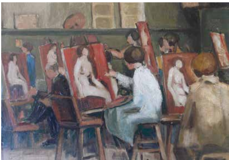
La Grande Chaumière , 1926 Óleo sobre tela 32,5 x 40 cm Colección Bernardita Mandiola

El Museo Nacional de Bellas Artes presenta el proyecto expositivo Ana Cortés: Reb/velada , el cual tiene como objetivo principal la reivindicación del trabajo artístico de la primera mujer en obtener el Premio Nacional de Arte, mención pintura en 1974. Para ello es imprescindible retroceder en el tiempo y posicionarnos en aquel contexto sociopolítico que marcó su vida profesional y privada que, en parte, se verá plasmado a través de su obra plástica. Es así que este corpus de obra se empieza a gestar con la enseñanza de sus primeros maestros: Richon Brunet y Juan Francisco González. A ellos se suma la influencia del artista francés André Lhote, de quien aprendió la profunda visión del arte moderno en Francia. Siendo en este país donde conocerá de cerca las corrientes vanguardistas de la época, las que nutrirán su labor artística y docente a lo largo de su vida.