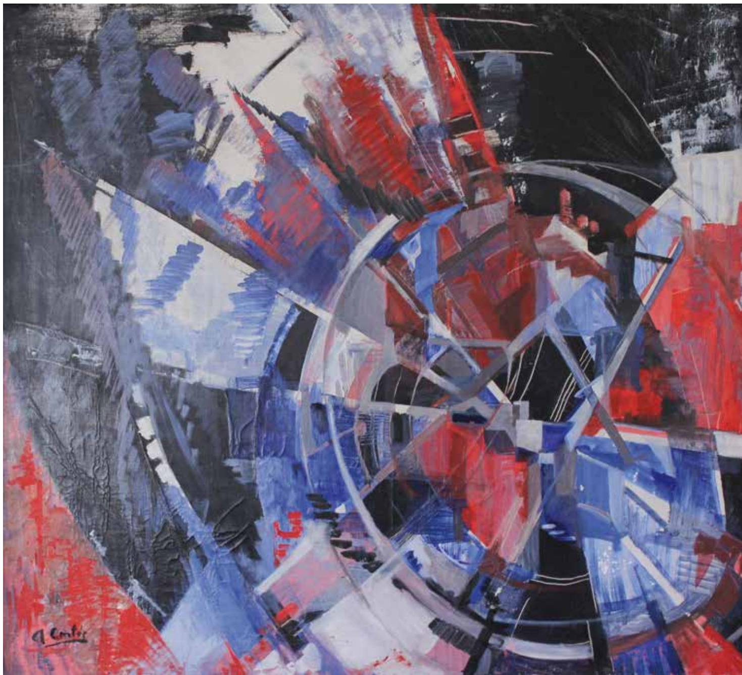
La rueda de la vida, sin fecha Óleo sobre tela 96,5 x 106,5 cm Colección particular