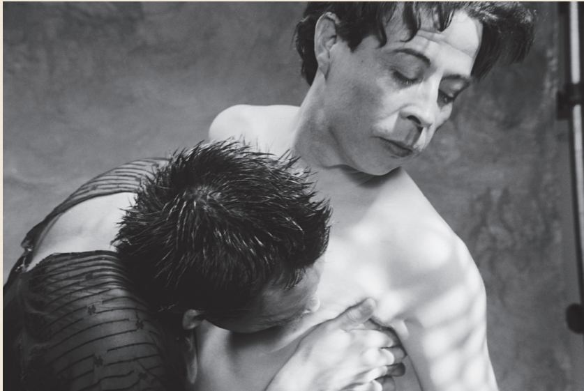
Lo que el sida se llevó, 1989