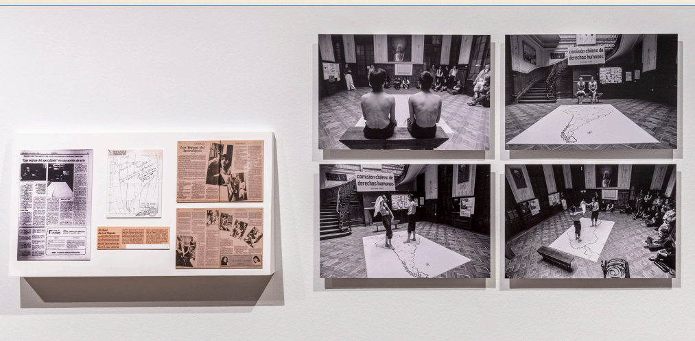
La conquista de América, 1989 Vista de registros en sala

La segunda figura es la de la Coca-Cola, emblema del imperio americano que sostuvo la dictadura militar chilena, entre otras tantas. La botella trizada puede aludir a la voluntad de hacer añicos un sistema que sigue colonizando el mundo en clave de globalización neoliberal o neoconservadora. Pero los fragmentos cuyos filos hieren los pies desnudos de los danzantes también pueden connotar los pesares de la “cueca sola”