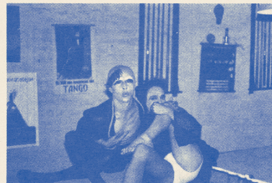
Que dan a los muchachos gotas de sucia muerte con amargo veneno.