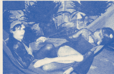
Maricas de las ciudades de carne tumefacta y pensamiento inmuado...*

Afectuosamente las Yeguas del Apocalipsis .