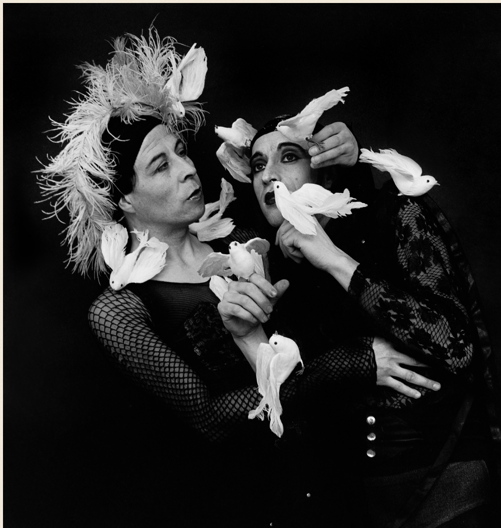
Instalamos pajaritos como palomas en alambritos, ca. 1990