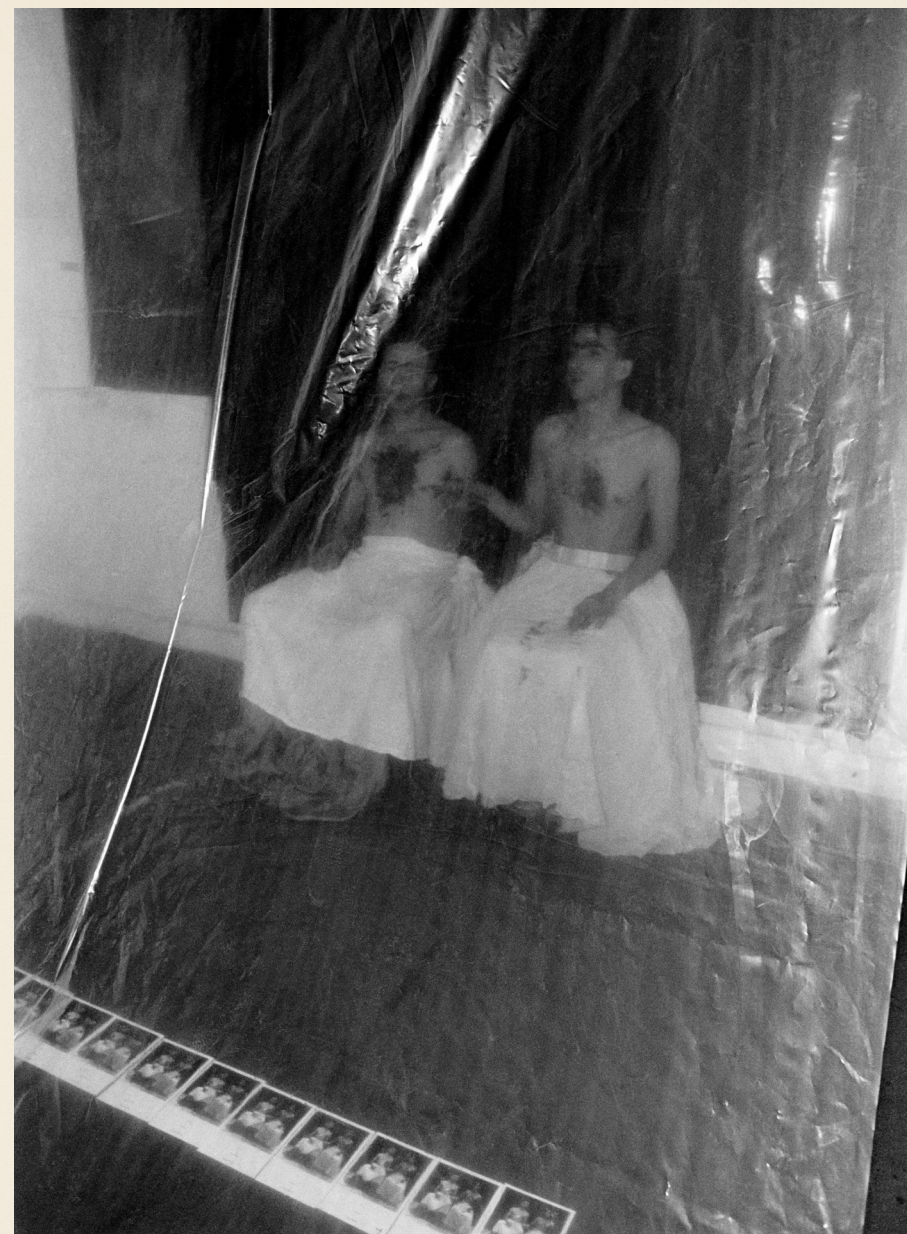
Performance Las Dos Fridas realizada en Galería Bucci, 1990

Desencadenaron una suma de intervenciones. Una tras otra y otra, efímeras o extensas, documentadas o sin registro. Intervenir mediante una acción de arte, significa interrumpir los ejes de una determinada circunstancia. En esos años, el concepto de “performance” no estaba establecido en el circuito chileno, entonces es más pertinente referirse a estas intervenciones como “acciones” que iluminaron la producción de acontecimientos.