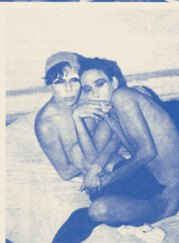
*Oda a Walt Whitman, fragmentos, F. García Lorca.