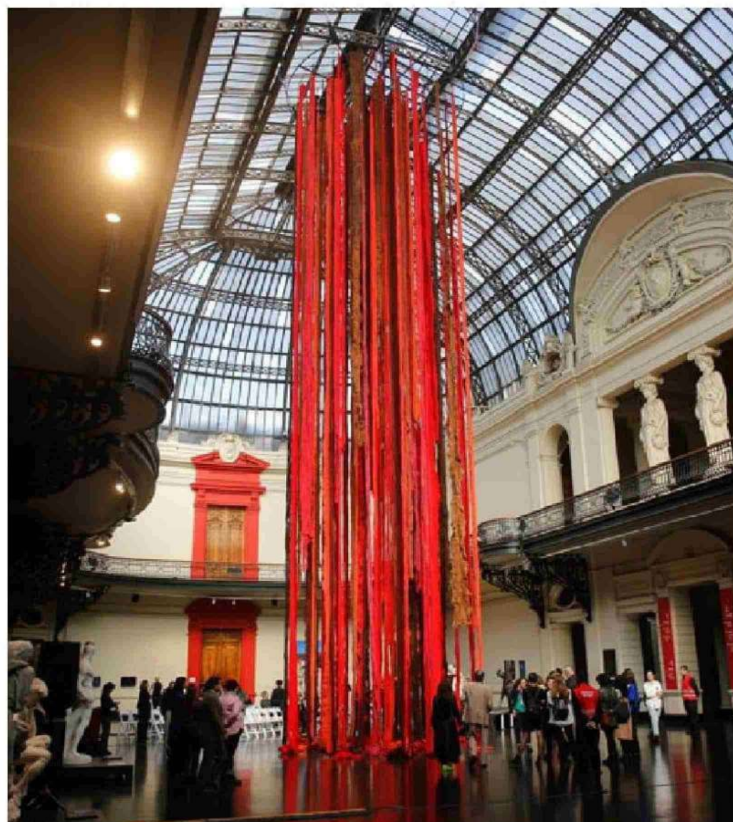
► El Quipu menstrual, la sangre de los glaciares, al centro del Museo de Bellas Artes.