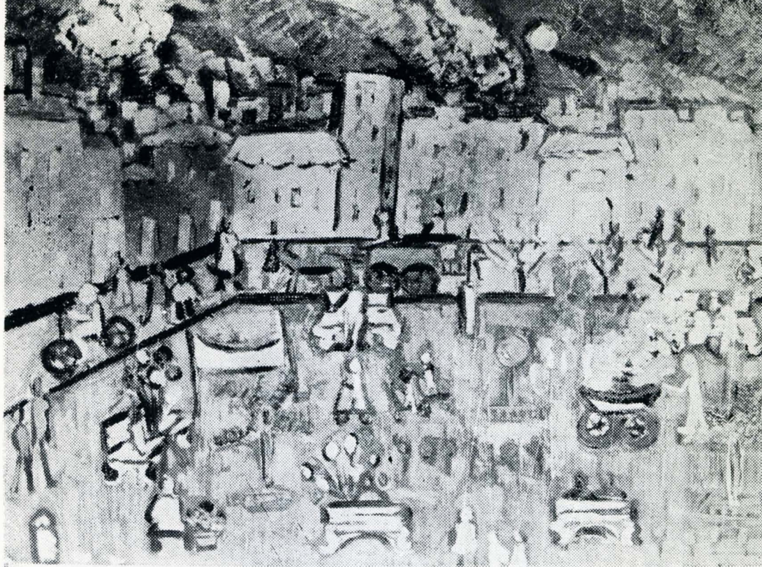
Primer Premio de Pintura: Yolanda Venturini