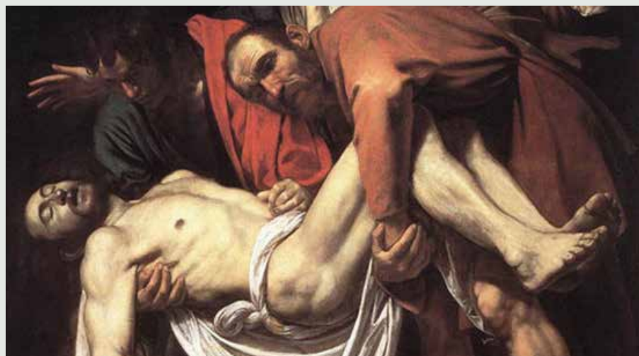
Desconocido | Copia de la Deposición de Caravaggio (detalle), s. XIX | Óleo sobre tela | 201 x 141 cm. | Museo Nacional de Bellas Artes