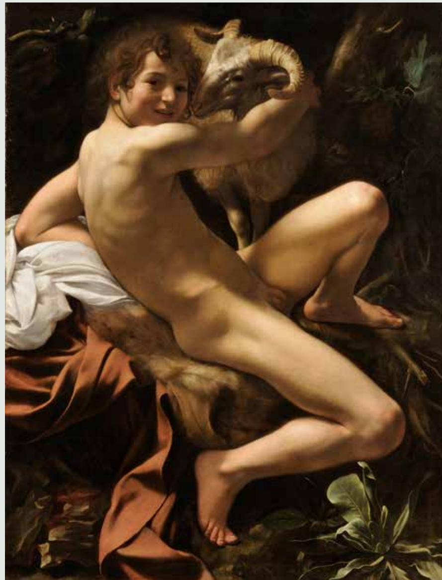
Caravaggio (Michelangelo Merisi) San Juan Bautista , 1602 Óleo sobre tela 129 x 95 cm. Roma, Museos Capitolinos - Pinacoteca Capitolina

Roberto Farriol Director Museo Nacional de Bellas Artes